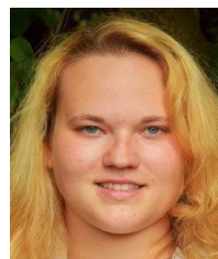
Präsident Franziska Imhof