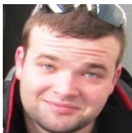
Präsident Philip Imhof